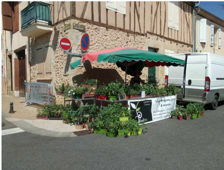
Une année inoubliable pour Laureline !

Oui, inoubliable ! Mais pas seulement à cause du Coronavirus.