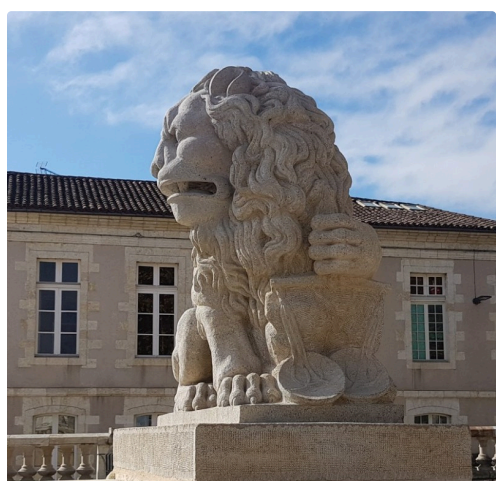
A gauche de la statue, le lion tenant la balance.