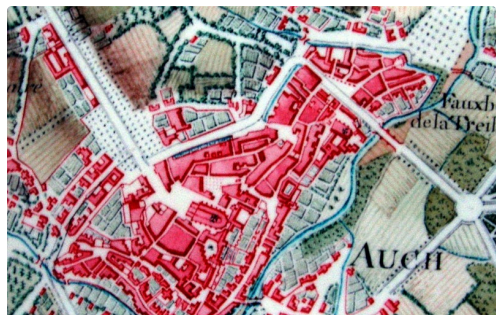
Auch, plan Trudaine, 1758, avant la construction de l'actuelle mairie, les Allées s'avancent jusqu'à l'alignement de l'actuelle rue Gambetta.