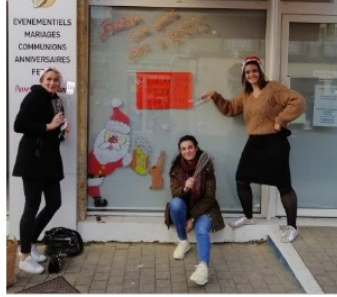
Les Mères Noël « anonymes » décorent les vitrines !

Peut-être avez-vous croisé hier après-midi un trio insolite, bonnet de Noël vissé sur la tête, escabeau sous le bras et feutres à la main.