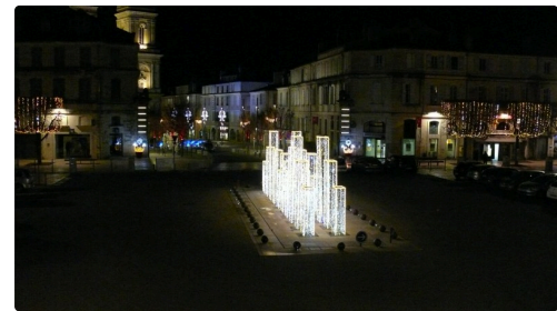
Le jet d'eau.