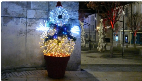
Un sapin original.