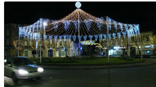
Chapiteau place de Verdun.