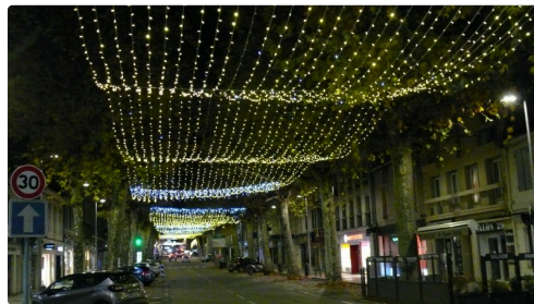
Illumination de l'avenue Alsace.