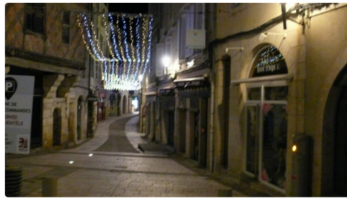
Entrée rue Dessoles.