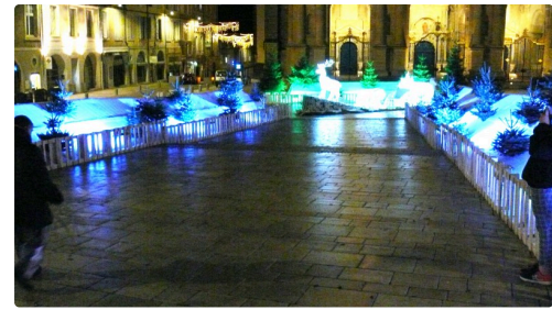
Parvis de la cathédrale.