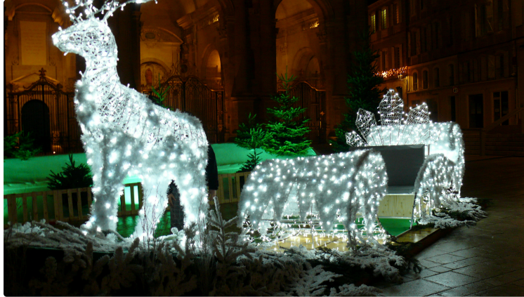
Auch, ville lumière

Comme prévu ce vendredi 27 novembre juste à la nuit tombée, les illuminations de la ville se sont mises à briller. Les années se suivent sans estomper l'émerveillement face aux scintillements des mille et une couleurs des guirlandes et des nouvelles décorations à l'exemple du traineau illuminé du Père Noël sur le parvis de la cathédrale.