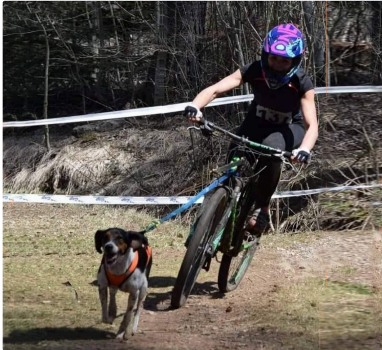
Cani'Oxy'Gers, une première dans le département

Loisir et sports unissant l'homme - ou la femme - et son animal