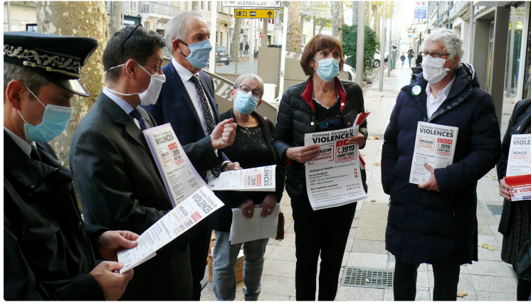
Les pharmacies gersoises dotées de pochettes d'emballage de médicaments

Ces pochettes mentionnent les numéros de téléphone à appeler en cas de violences intrafamiliales