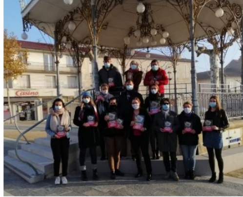
Le catalogue de Noël des commerçants et artisans vicois est arrivé !

Après la création d'un organisme communautaire, Les « Non Essentiels Vicois », qui a sa page facebook, après la création d'une vidéo largement diffusée sur le net, après la mise en place du drive, voici la dernière action en date des commerçants et artisans vicois, un catalogue de Noël 100 % vicois !