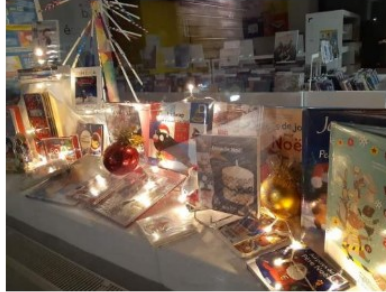
Des nouvelles de votre médiathèque !

Comme vous le savez maintenant, suite aux décisions gouvernementales, la Médiathèque n'est plus autorisée à accueillir de public depuis vendredi 30 octobre.