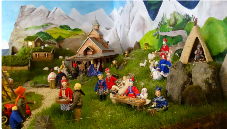
Les Merveilles du Monde attendront

Car le rendez-vous de la Ronde des Crèches est reporté en décembre 2021