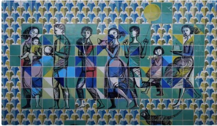
Les collégiens découvrent les azulejos

L'Association des Arts Plastiques de Plaisance a réalisé une vidéo pour leur en faire découvrir l'histoire