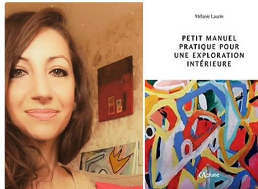
Petit manuel pratique pour une exploration intérieure

C'est un livre qui tombe à pic, en cette période de confinement bis, où chacun s'organise comme il peut pour ne pas sombrer dans une mélancolie, qui pourrait devenir pernicieuse.