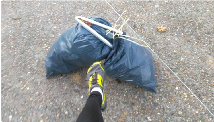
Connaissez-vous le plogging ?

Un néologisme, apparu en 2016, né de la contraction d'un mot suédois "plocka upp" (ramasser en suédois) et du terme anglais jogging. Idéal pour l'entraînement, cette pratique permet de varier les mouvements du corps en ajoutant des flexions, des accroupissements et des étirements à l'action principale de la course. L'idée même de collecter les déchets en courant (ou en marchant) n'est pas nouvelle, de nombreux citoyens se mobilisent depuis des décennies pour sauver la planète. La devise du plogging : "avoir un corps sain dans un environnement sain".