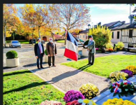
1 DR Christian Peyret 1bis 111120.JPG

N.B. - Les photos ont été communiquées par Christian Peyret.