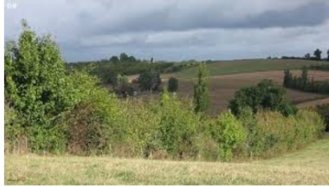
Plaidoyer pour une haie

Près de 70% des haies présentes en France ont disparu en 150 ans , arrachées sous l'effet conjoint du remembrement agricole et du déclin de l'activité d'élevage au profit de la céréaliculture intensive.