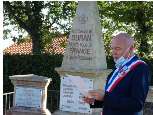
Le maire de Duran, Jean-Marc Dupuy, lors de la lecture du message ministériel.