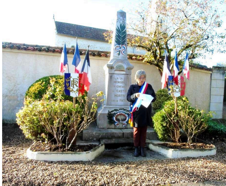
Commemoration du 11 novembre : Auch, Castin et Duran à huis clos

Compte-tenu de l'état d'urgence sanitaire et des mesures de confinement, les cérémonies du 102e anniversaire de l'Armistice du 11 novembre 1918 ne se sont pas tenues dans le format habituel cette année. Tant à Auch qu'à Castin et Duran c'est quasiment à huis clos que fut déposée une gerbe, respecté la minute de silence, chanté la Marseillaise et lu le message de Geneviève Darrieussecq, ministre déléguée auprès de la ministre des Armées, lequel se conclut en ces termes : « Chaque 11 novembre, la Nation rend également un hommage solennel à tous les morts pour la France, ceux d'hier et ceux d'aujourd'hui. Chaque année, nous rappelons leur nom ».