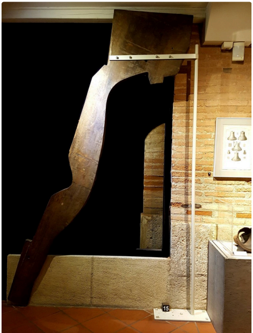
Gabarit de la cloche Jeanne d'Arc (outils indispensables à la réalisation d'une cloche) par la fonderie Paccard, à découvrir au Musée