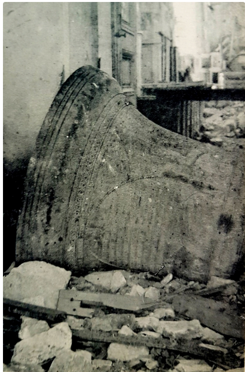
998. La Grande Guerre 1914 16 L'Eglise de BARCY — La Cloche parmi les décombres