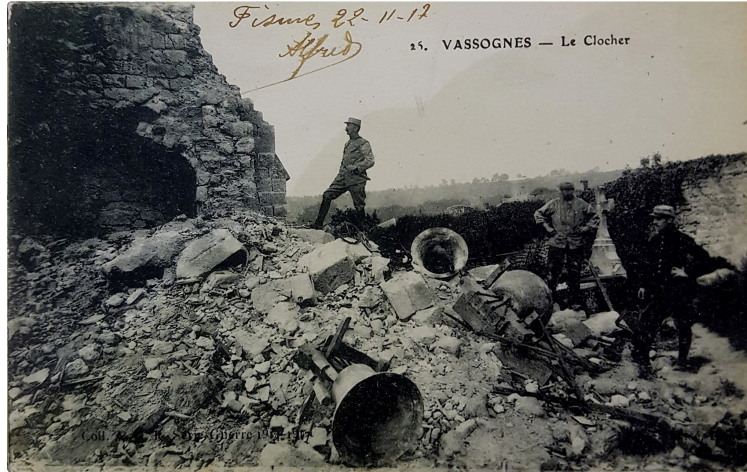
Souvenirs historiques : le rôle des cloches durant la guerre 14-18