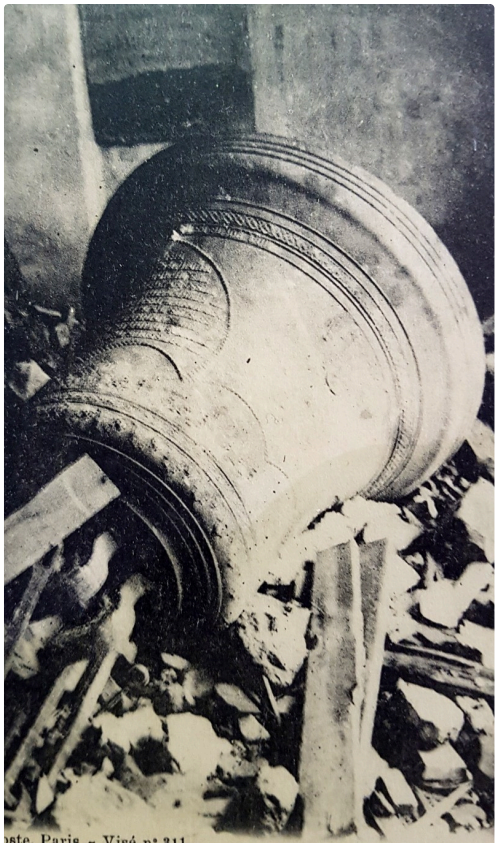
111. Intérieur de l'Église de Barcy « La Cloche