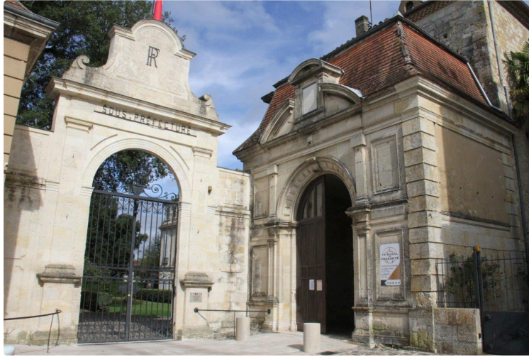
La nouvelle sous-préfète arrive des Hauts-de-France

Avec un parcours très orienté sanitaire et social