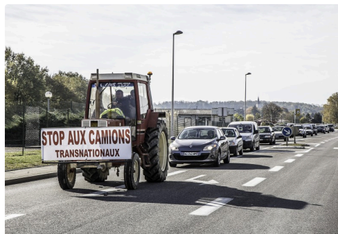
Opération escargot le 7 novembre 2017