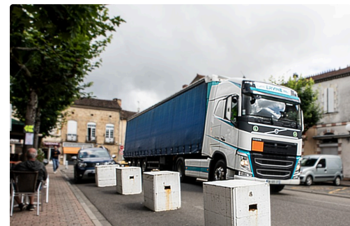
Camion au centre de Nogaro