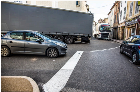
Camion au centre de Nogaro