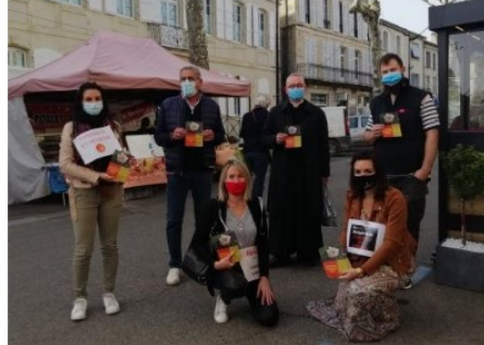
Les "Non Essentiels vicois" sur le marché

Après la création d'un organisme communautaire Les « Non Essentiels Vicois » qui a sa page facebook, après la création d'une video largement diffusée sur le net, les voici aujourd'hui sur le marché plein air de Vic.