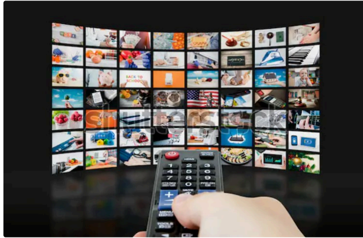
A la télévision vendredi soir...

Agatha Christie à l'honneur en ce vendredi soir sur France 2 et Canal Plus, Belmondo au mieux de sa forme et un drame émouvant sur Chérie 25