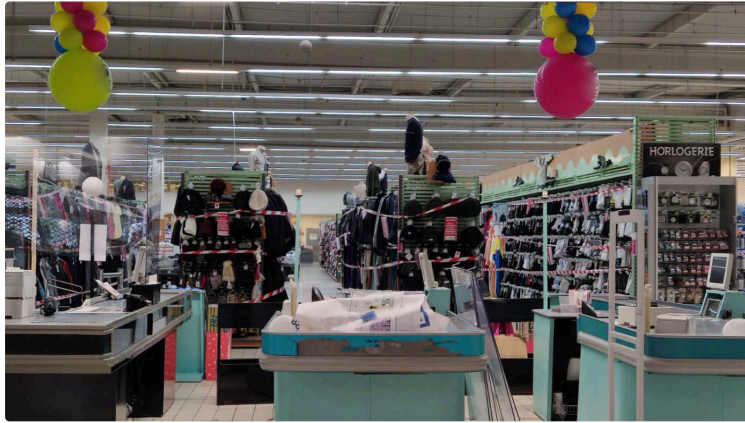
Plutôt que d'autoriser les petits commerces à rouvrir, le gouvernement a tranché

Cette année, ce ne sont pas les guirlandes de Noël qui servent de décoration