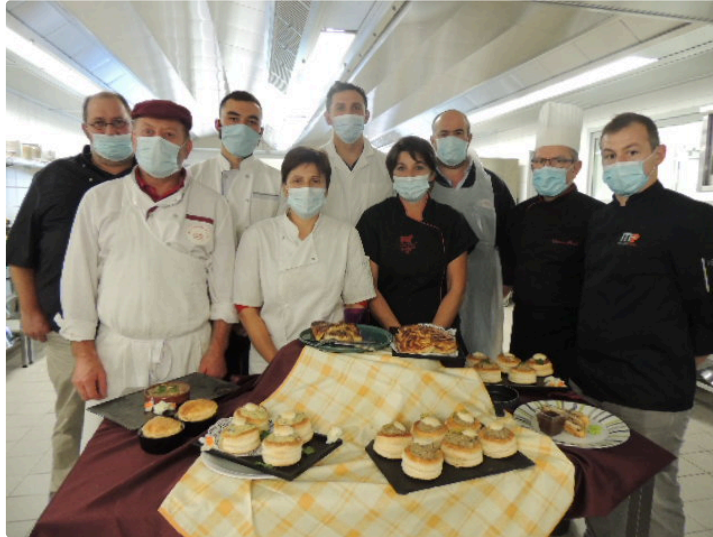
Les artisans bouchers-charcutiers gersois se perfectionnent à l'Ecole des métiers

Durant une journée ils ont abordé les techniques sur les farces et sur différents montages de produits salés.