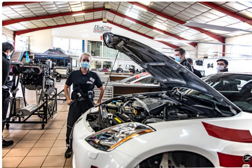
Dans l'atelier auto