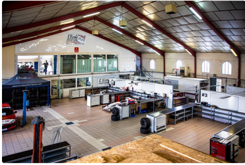
Intérieur de l'Ecole

L'accès privilégié au circuit de Nogaro, ainsi que la possibilité d'effectuer certains essais sur l'aérodrome tout proche sont des atouts de poids pour l'École.