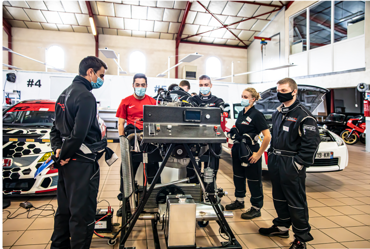
Une pépite à Nogaro : l'École de la performance