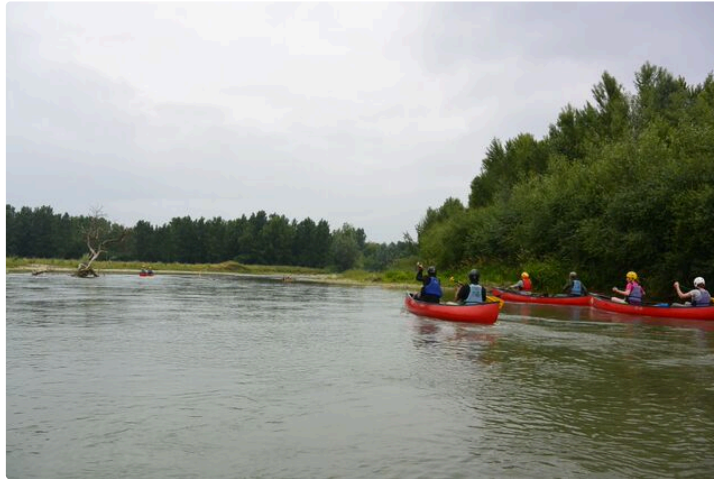
Rencontre autour de l'eau