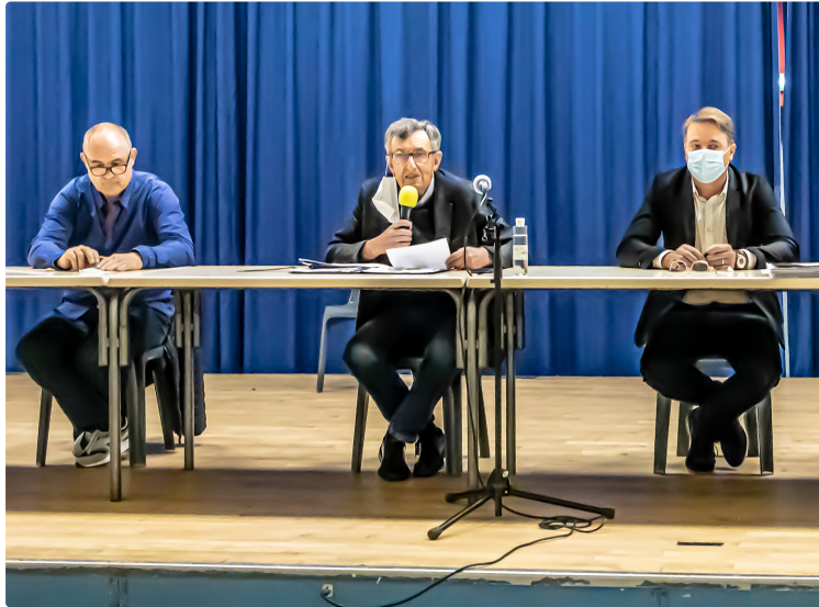
Le Sictom Ouest expose les problèmes actuels et futurs posés par les déchets (mis à jour le 02.11.2020)

Leur accroissement est difficile à arrêter