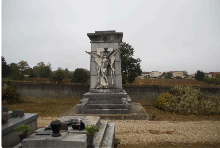
Miélan, La Havane, un ange veille

Toussaint, c'est l'époque de se rendre dans les cimetières pour honorer ses disparus, entretenir et fleurir les tombes. Ça peut être aussi le moment de parcourir les allées des cimetières en regardant les pierres tombales, les plaques nominatives.