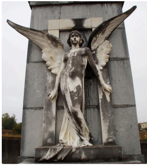
"L'ange de Miélan"