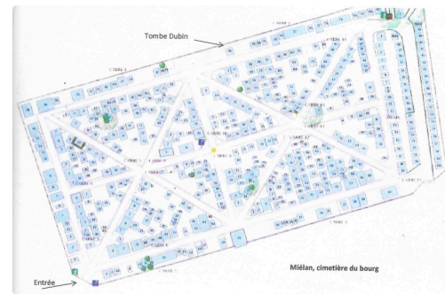
Plan Miélan tombe Dubin.jpg