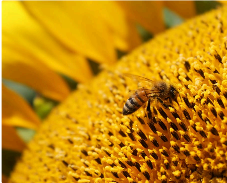
Plantiez des arbres pour aider les abeilles

... et soutenir une biodiversité qui s'essouffle