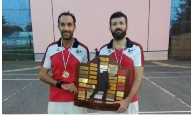
Le Pilotariak Auscitain repart une nouvelle fois avec le trophée

La récompense du Tournoi de l'Armagnac disputé à Mirande