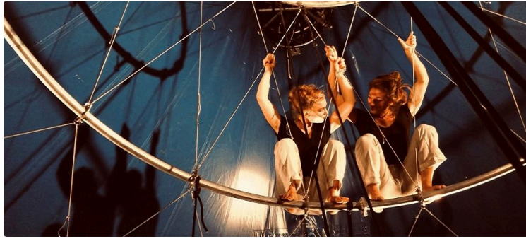
On fait quoi ce week-end