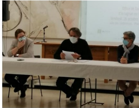
Assemblée générale de l'Office de Tourisme d'Artagnan en Fezensac : un bilan 2019 positif, des projets et une nouvelle orientation