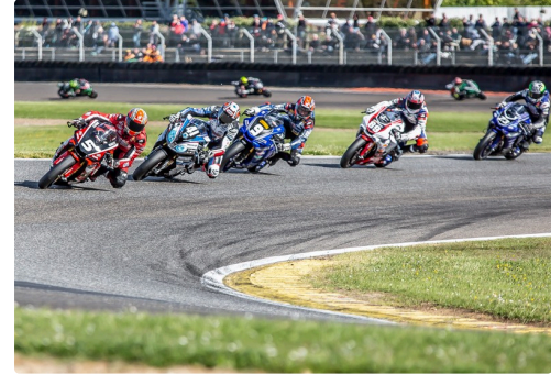
Peloton Superbike en mai 2019