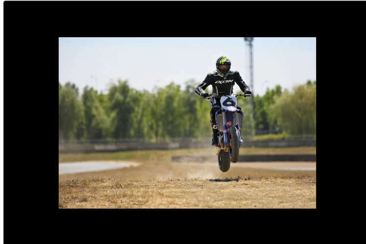
Championnat de France Superbike du 23 au 25.10 à Nogaro