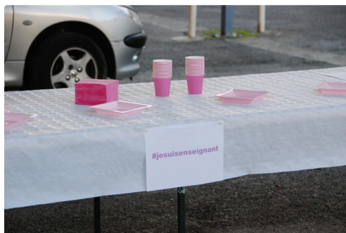
En mémoire de Samuel Paty.