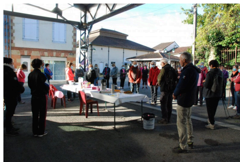
Une minute de silence.