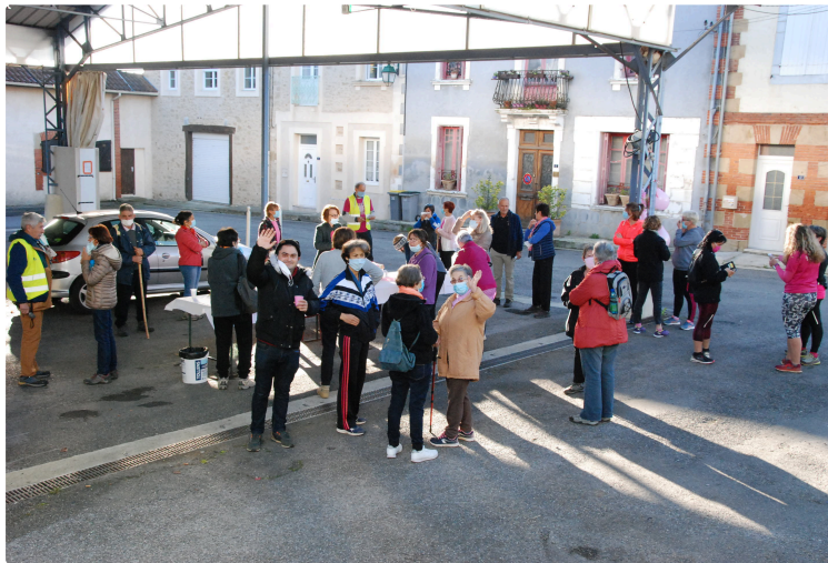
Randonnée du 18 octobre 2020

Comme chaque année, le mois d'octobre est une période de sensibilisation à la prévention et la prise en charge du cancer du sein, chapeauté par la Ligue contre le Cancer.