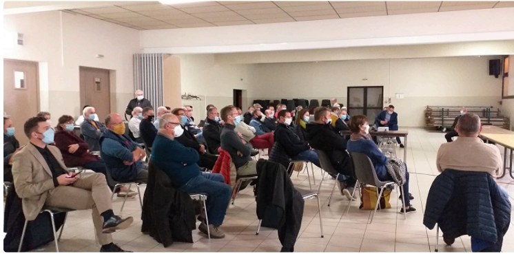
Artisans et commerçants en première ligne !

La municipalité les invite à partager ses projets