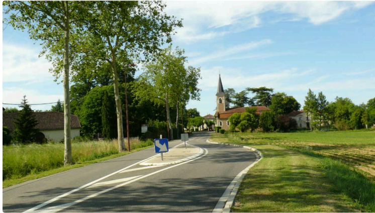
Les castelnaux de Gascogne : à découvrir grâce aux Motivés