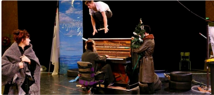
Grand Auch : On fait quoi ce week-end?

Du 16 au 25 octobre, le Festival CIRCa vous plonge au cœur des dernières créations les plus qualitatives des arts du cirque. Avec un peu moins d'animations pour vous assurer un accueil en toute sécurité, la 33e édition vous promet des beaux moments suspendus, remplis d'émotions. Et voici votre agenda des animations du vendredi au dimanche, dans le Grand Auch Cœur de Gascogne :