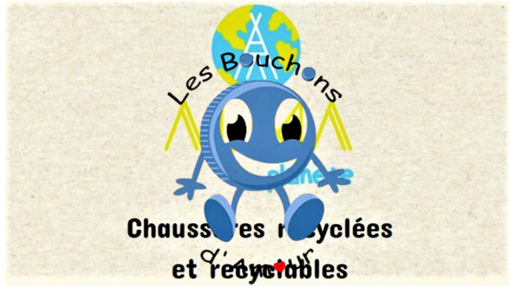
partenariat "les bouchons d'amour" - Alma Planète