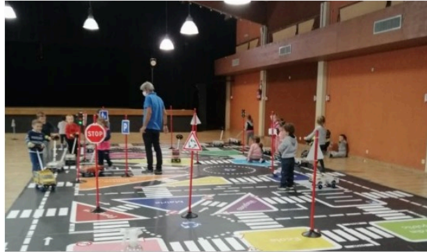
"Bouger en sécurité", c'est parti !

L'opération de prévention routière initiée par le centre social Vic Accueil a démarré mercredi et se prolongera jusqu'au samedi 17 octobre inclus.