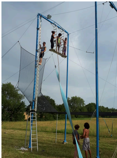
Initiation trapèze grand volant

Une deuxième orientation de notre association est notre travail en direction du patrimoine bâti et paysager pour le réhabiliter et lui redonner vie tant sur les espaces extérieurs que sur le bâtiment dans le respect des savoir-faire traditionnels ; au fur et à mesure, on essaie de réhabiliter des espaces pour accueillir d'autres activités sur le site.