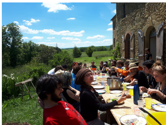
Tablée chantier collectif

Un troisième volet relève de notre envie de contribuer au développement économique de notre territoire et de ce site et pour cela on accueille des porteurs de projets , il peut d'agir de jardins comme de la location d'espaces pour en faire un atelier ou un bureau.