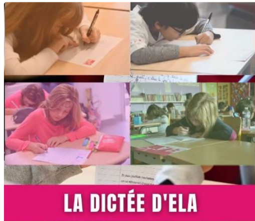
Rugby et littérature : une dictée pour une grande cause

Lundi prochain, le 12 octobre, les élèves de CM1, de CM2 et de 6e de l'ensemble scolaire Notre-Dame de Piétat participeront à la dictée d'ELA (Association européenne contre les leucodystrophies), à 10 h.