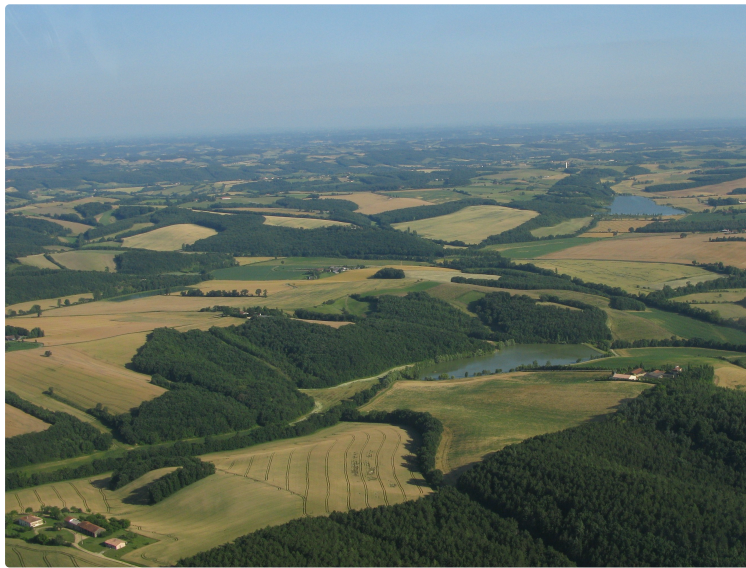
Grand Auch Coeur de Gascogne : L'agenda du 9 octobre au 11 octobre

Samedi, à l'occasion de la Journée nationale du commerce de proximité, les commerçants d'Auch vous attendent pour de nombreuses animations ! Et dimanche, les artistes vous ouvrent les portes de leurs ateliers dans le Gers. Partez à leur rencontre et découvrez leurs univers. Et voici votre agenda des animations du vendredi au dimanche, dans le Grand Auch Cœur de Gascogne :