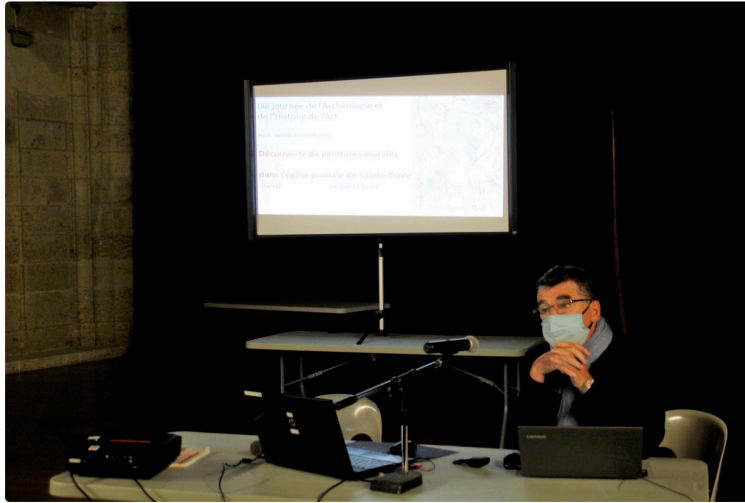
La journée des archéologues

La journée des archéologues organisée par la Société archéologique et historique du Gers, s'est déroulée cette année à Auch, salle Cuzin, ancienne chapelle du séminaire. Elle a permis d'entendre les communications de découvertes récentes dans le Gers.