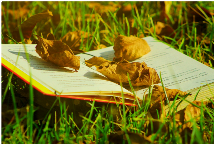
À vos marque-pages !

Chaque premier samedi du mois, le Journal du Gers vous propose une balade chez les libraires et vous révèle leurs coups de cœur du moment.