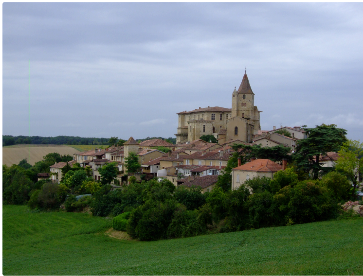
Coeur de Gascogne : Que faire ce week-end

Voici votre agenda des animations du vendredi au dimanche, dans le Grand Auch Cœur de Gascogne. Le 7ème art est à l'honneur, si on se faisait une toile?