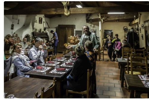
Le restaurant de la Ferme aux cerfs