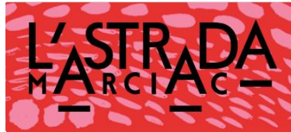
L' Astrada le week end d'ouverture

Théâtre, musique, cirque et manège pour les tous petits !