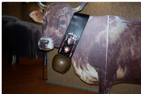
expo musée de L'isle Jourdain les Sonnailles 007.JPG

A noter : ce dimanche 4 octobre, il sera ouvert aux mêmes heures..car le musée est ouvert une fois par mois le premier dimanche