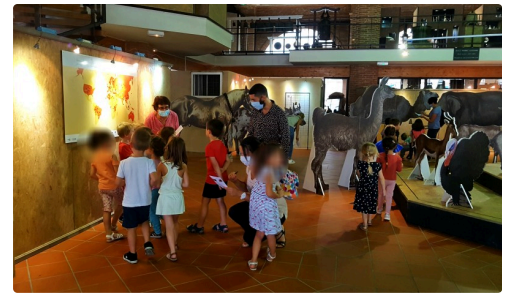
Lors d'une visite scolaire