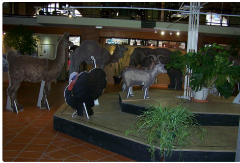
expo musée de L'isle Jourdain les Sonnaillies 009.JPG