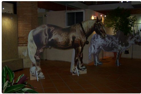
expo musée de L'isle Jourdain les Sonnaillies 001.JPG