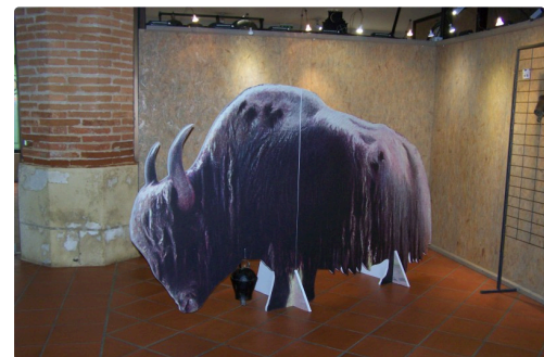
expo musée de L'isle Jourdain les Sonnailles 005.JPG