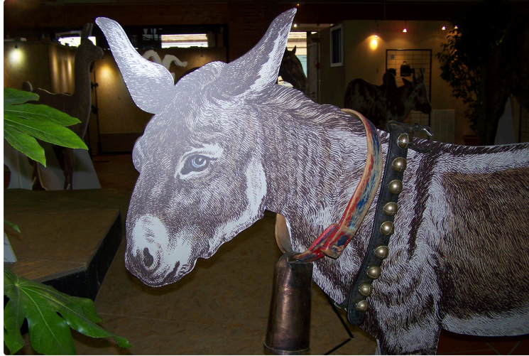
Une passion au fil des années..la donation Killick-Kendrick