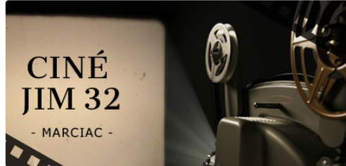
Ciné JIM 32

Programme du 29 septembre au 13 octobre 2020