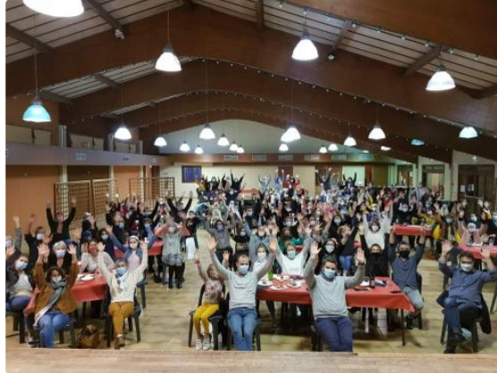
Théâtre à Vic : une première réussie !