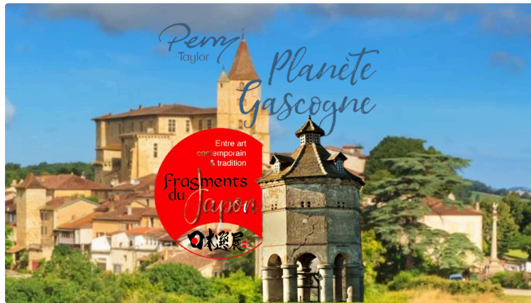
Un été au château de Lavardens

dernier week-end pour le Japon et les pigeonniers