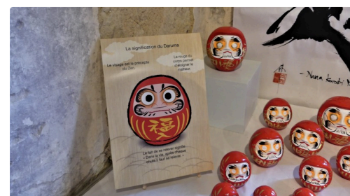
Avez-vous acheté votre daruma porte bonheur ?