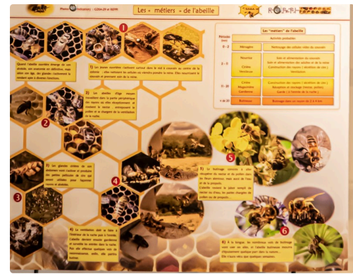
Panneau les métiers de l'abeille