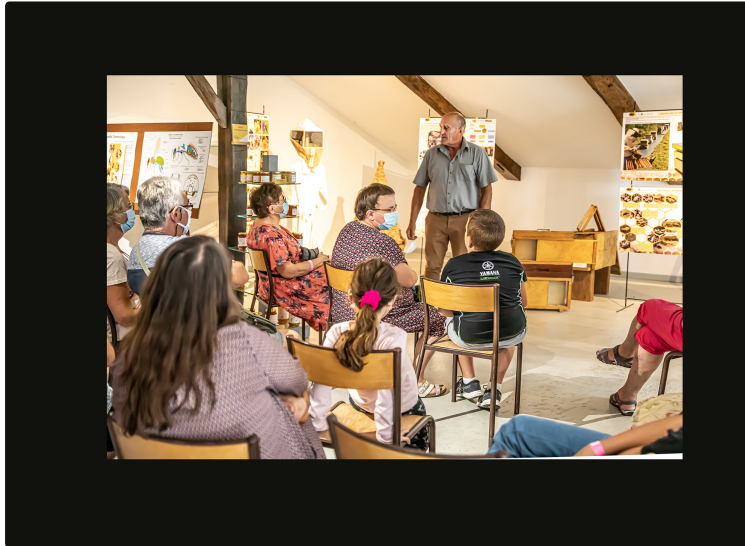
Les abeilles, leur miel et leur cire au Musée de Toujouse

Pour Les Journées du patrimoine, le Musée du paysan gascon a mis les projecteurs sur les abeilles, leur vie, leurs mœurs, leur travail. Et aussi, bien entendu, sur la fabrication et la récolte du miel et de la cire.