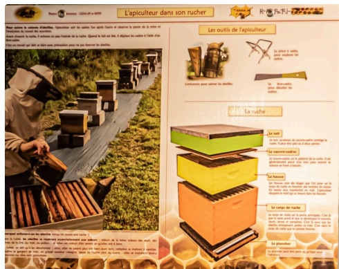
Panneau l'apiculteur et son rucher